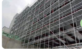
| 시스템비계 |