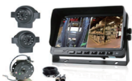
| 지게차 충돌예방설비 |