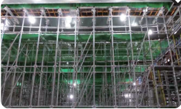
| 시스템동바리 |