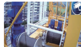
| 소형타워크레인 안전장치 |