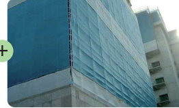
| 수직보호망 |