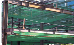
| 추락방호망 |