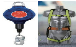
| 안전블럭 세트 |