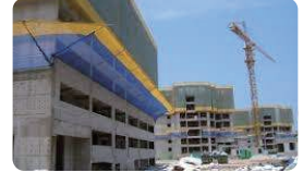
| 낙하물방지망(방호선반) |