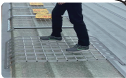
| 지붕창 채광덮개 |