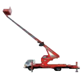
| 고소작업대(시저형, 굴절형, 차량탑재형) |