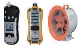
| 화재폭발예방설비 |