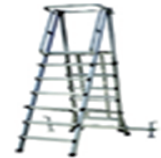
| 사다리형 작업발판 |