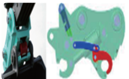
| 굴착기 충돌재해예방설비 |