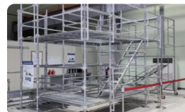
| 선행안전난간 |