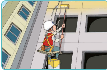
5 달비계 작업 시 안전대 및 구명줄 설치