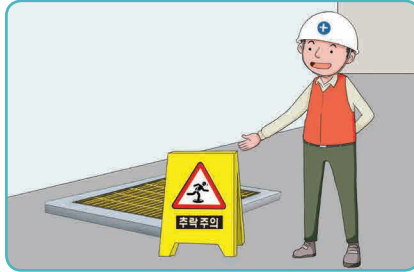
2 개구부 덮개 및 경고표지 설치