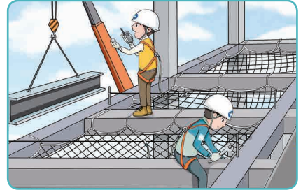
3 추락방호망 설치