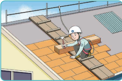
4 지붕 위 작업 시 작업발판 등 설치