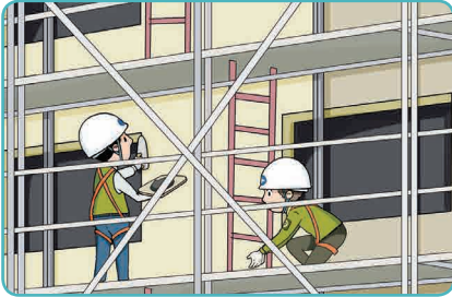
1 추락위험장소에 안전난간 설치