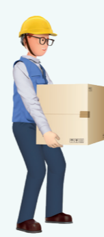
허리는 펴고 무릎은 구부린 채로 다리 힘으로 들어올리기