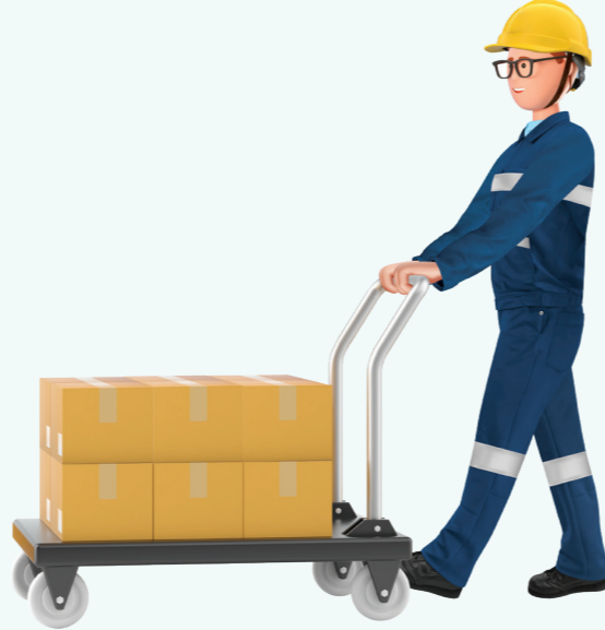
5 중량물 이동대차 이용