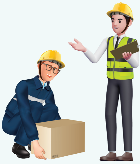
4 올바른 중량물 취급 자세 교육