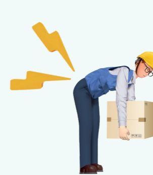
허리를 구부린 채로 중량물 들어올리기