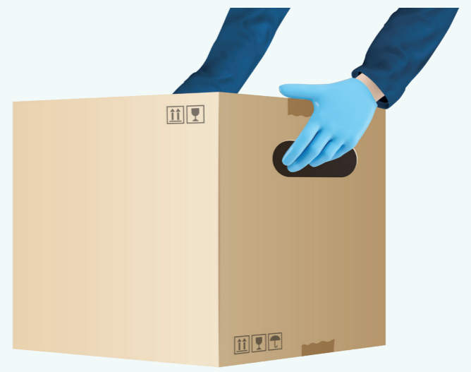
6 상자 손잡이 등 보조도구 설치