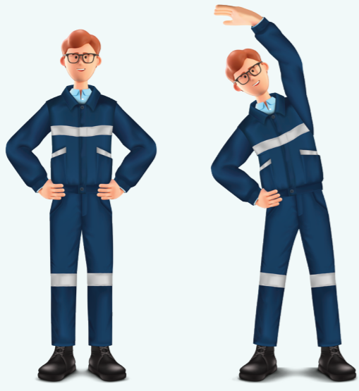
1 작업 전·후 스트레칭 실시