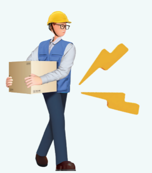
물체를 들고 불안정한 상태로 이동