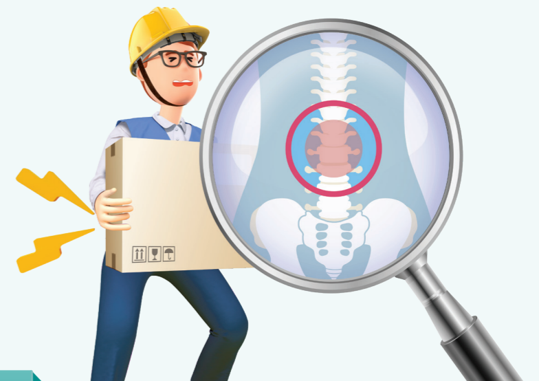
9 유해요인 조사 및 작업환경 개선