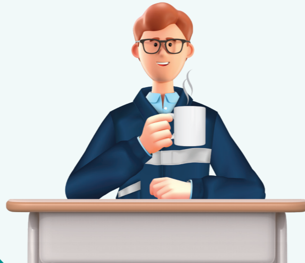
8 정기적 휴식시간 제공