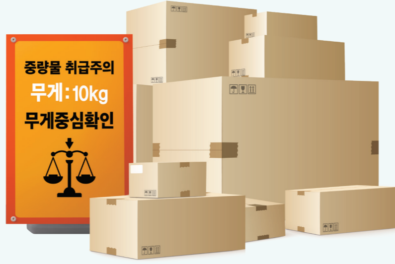
2 물품 중량 및 무게중심 표시