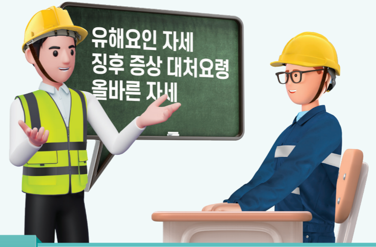
3 근골격계부담작업의 유해요인 등 교육