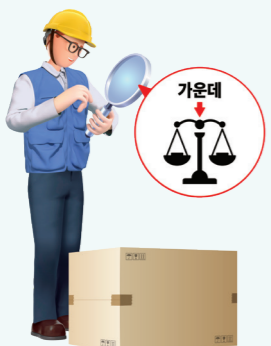
중량물의 무게중심 확인