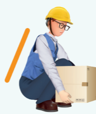
쭉그리고 앉아 물체를 몸에 밀착시켜 안정되게 잡기