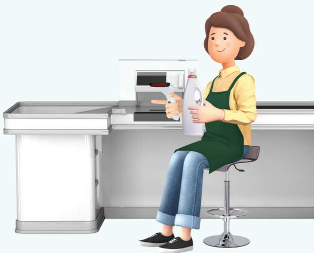
7 서서 일하는 근로자에게 의자 제공