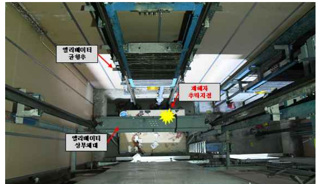
< 사고발생 구간 현황 >