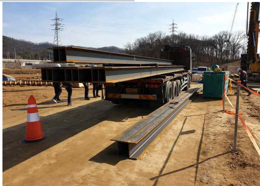
< 사고발생 위치 >