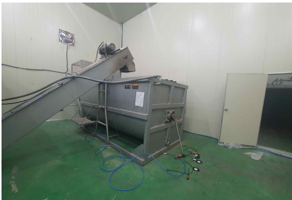
< 재해발생 배합기 >