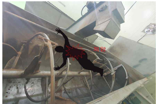
< 재해발생 상황도 >