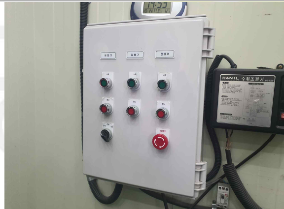
< 운전판넬 >