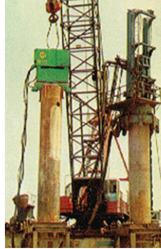
〈그림 2〉 항발기