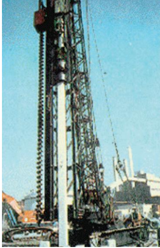
〈그림 1〉 항타기